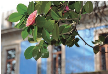
Pazo de Gandarón