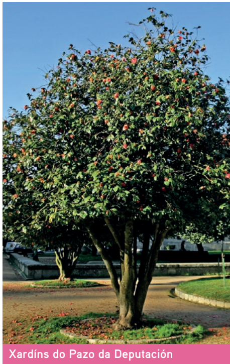
Xardíns do Pazo da Deputación