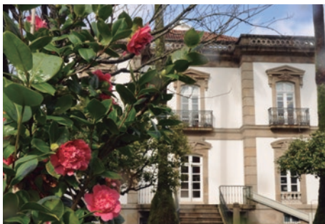
Palacete das Mendoza