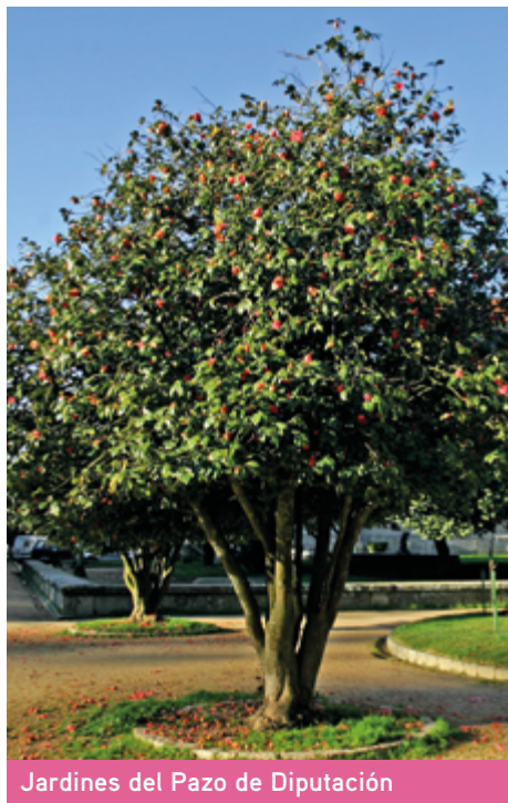
Jardines del Pazo de Diputación