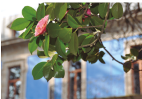
Pazo de Gandarón