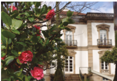
Palacete de las Mendoza